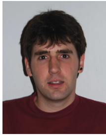
Président : Bixente TELLECHEA